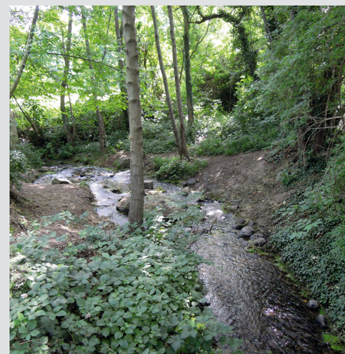
renaturierter Bachlauf

Die Gestaltungselemente Die Planung verbindet die unterschiedlichen Nutzungsansprüche der Bevölkerung und die Belange des Naturschutzes. So kann sich der Bachlauf natürlich entwickeln. Im südlichen Bereich findet sich – abgeschirmt durch eine Waldfläche – Platz für sportliche Aktivitäten. Auch der Siedlungsrand hat an den meisten Stellen einen ausreichenden Abstand zum Bachlauf.