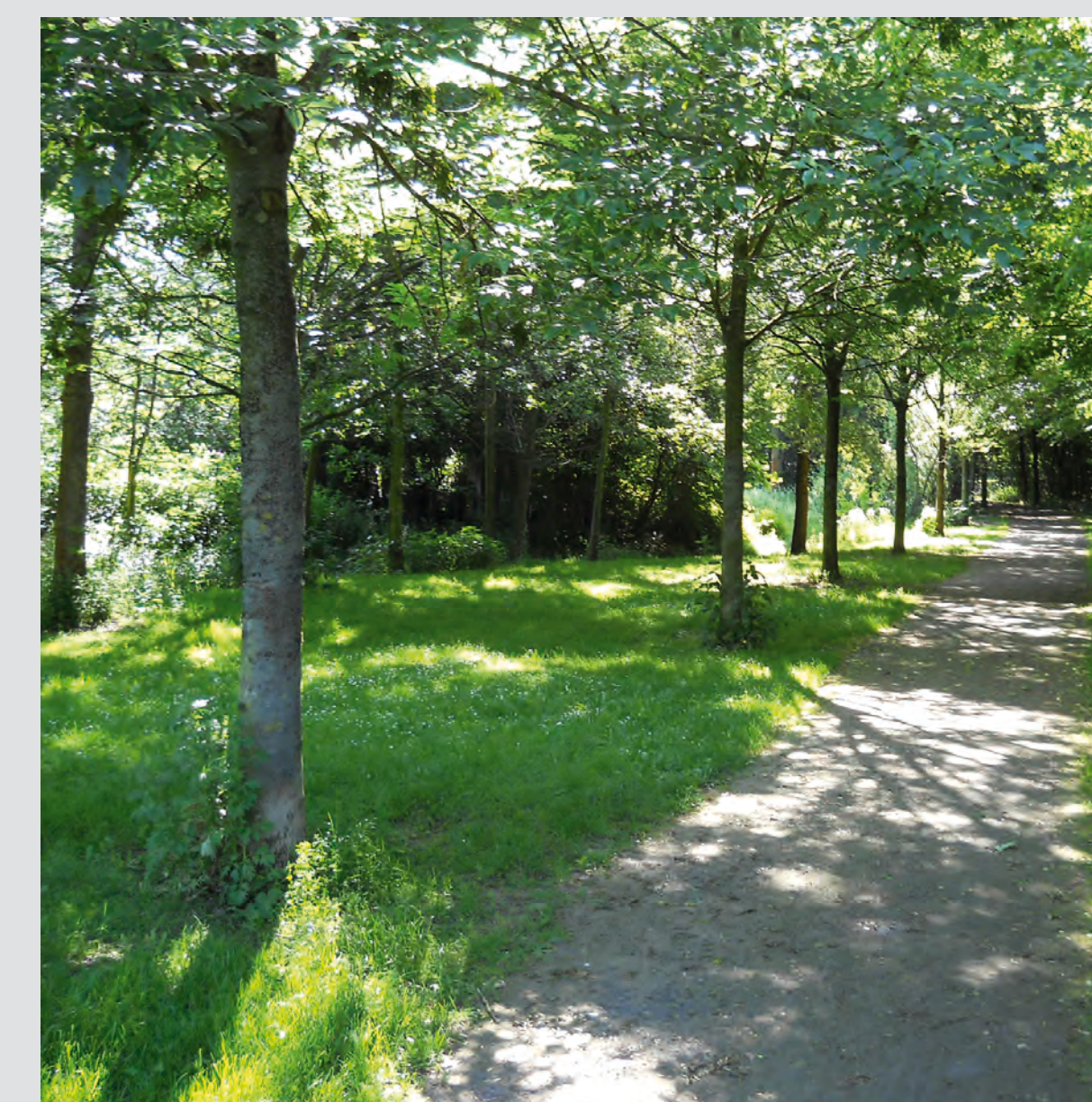
Weg am renaturierten Bach