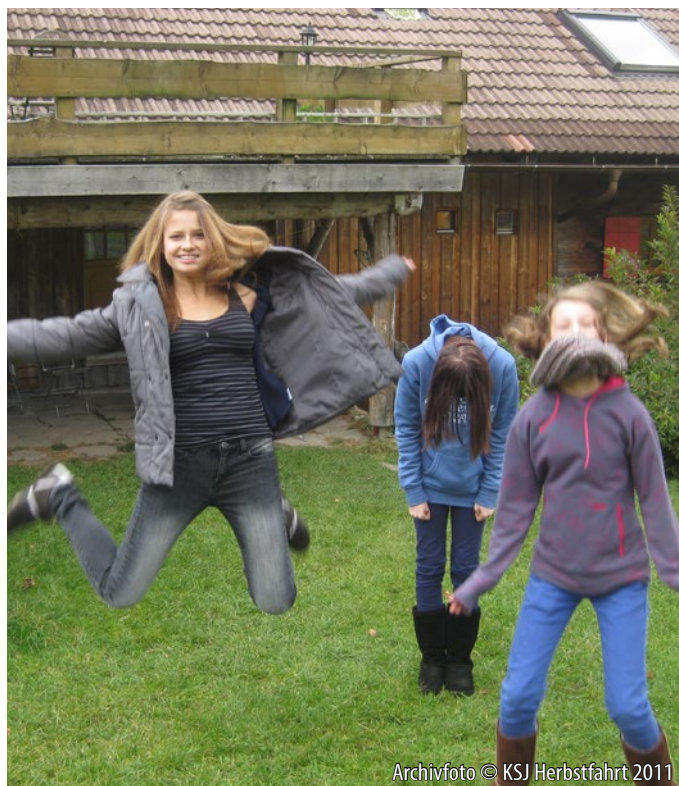
Archivfoto © KSJ Herbstfahrt 2011