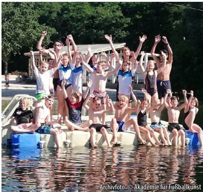
Archivfoto © Akademie für Fußballkunst