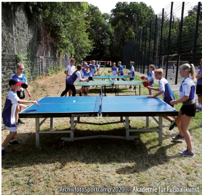
ArchivfotoSportcamp 2020 © Akademie für Fußballkunst