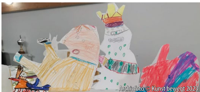
Archivfoto © Kunst bewegt 2023