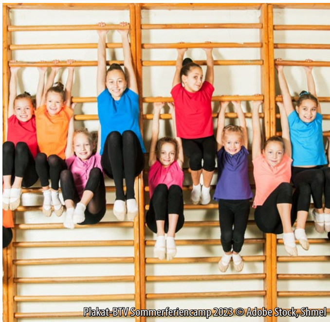
Plakat-BTV Sommerferiencamp 2023