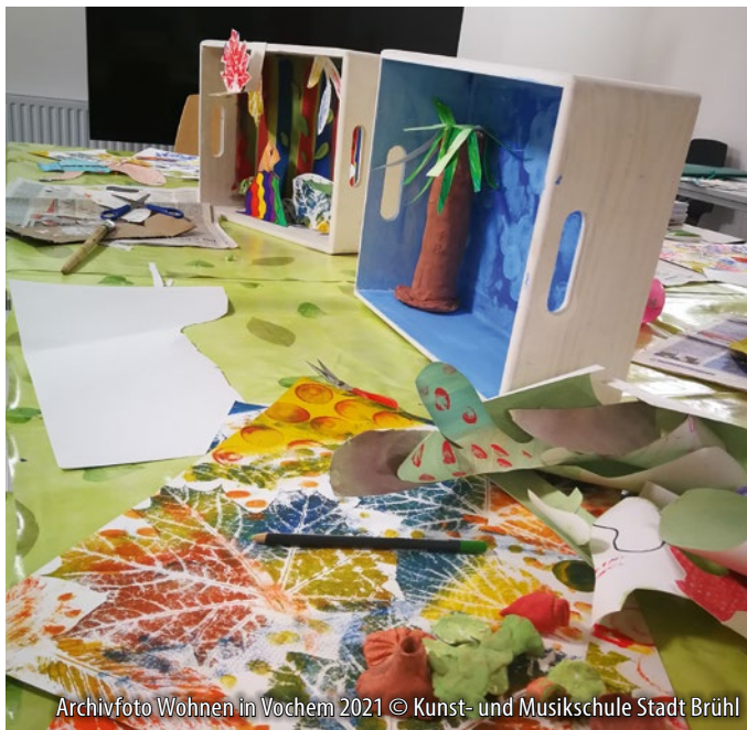
Archivfoto Wohnen in Vochem 2021