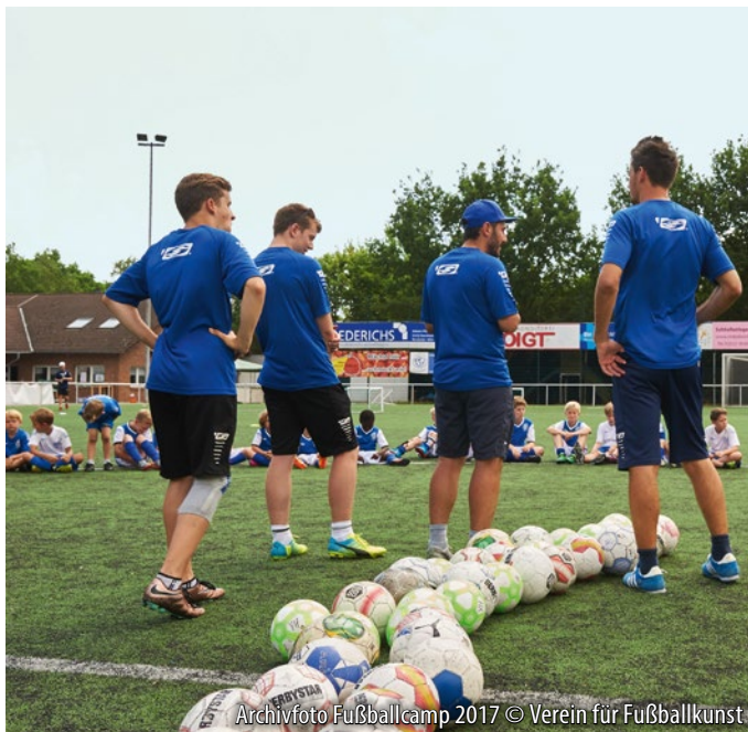
Archivfoto Fußballcamp 2017