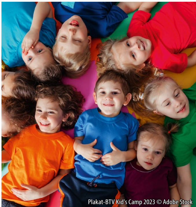
Plakat-BTV Kid's Camp 2023